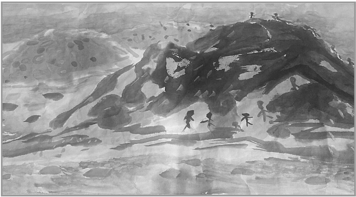
한국미술대전 특선 작가 김창남 화백 그림성경

성바탕은 위성으로부터 직접 전파를 송신하기 때문에 화질의 저하가 적고 화상이 깨끗하고, 전국 동시 방송이 가능하다는 것입니다. 그런데 여기서 중요한 것이 있습니다. 그것은 이러한 모든 방송은 방송국 시그널(신호)을 받아야 한다는 것입니다. 또한 단순히 시그널을 받는다고 하면 이 나오는 것은 아닙니다. 셋톱박스(set top box)라는 외부에서 들어오는 신호를 받아 적절히 변환해주는 장치를 설치하고 리모컨으로 전원을 켜야 비로소 화면을 시청하게 된다는 것입니다. 신앙생활도 마찬가지로