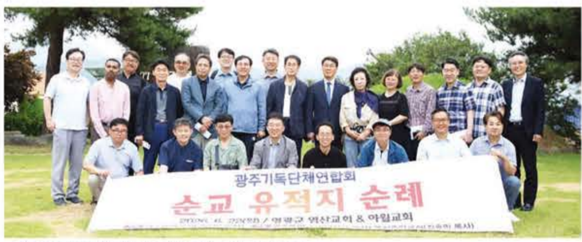
광주기독교단체연합회가 염산교회와 야월교회 순교유적지를 탐방했다.