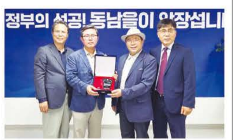
광주광역시기독교교단협의회가 안도걸 국회의원에 감사패를 증정했다.

이날 전달된 감사패에는 "의원님께서 양림의 빛나는 역사와 선교문화유산이 유네스코라는 세계의 무대에서 그 가치를 인정받을 수 있도록 토대를 세우시기 위한 열정과 헌신을 보여주셨다"는 내용이 담겼다. 이어 "양림 선교문화유적과 정신을 이어가는 위대한 발걸음에 함께해 주신 큰 공로를 기리며 감사의 뜻을 이 때에 새겨 드린다"고 밝혔다. 광주 양림동은 한국 근대 선교 역사와 함께 교육, 의료,